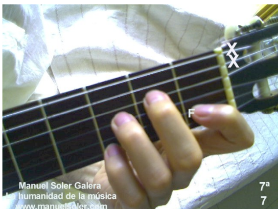
Re7, Fund Traste 3