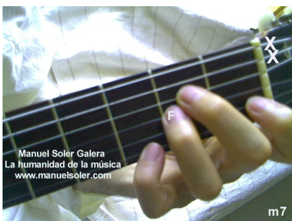
Sim7, Fund Traste 4