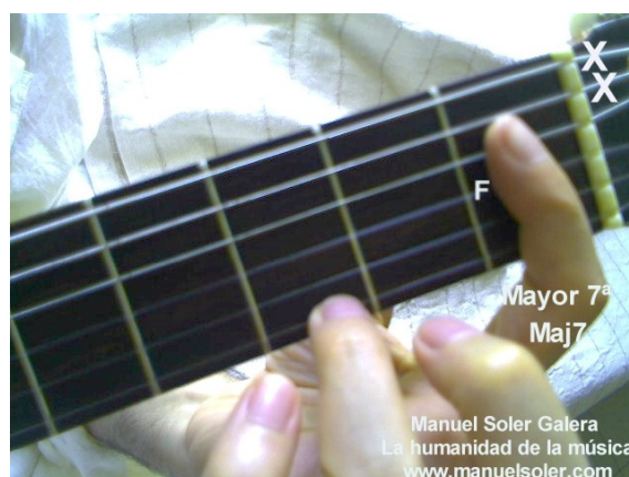
Do Maj7, Fund Traste 5