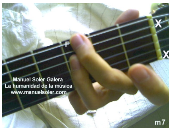
Fa#m7, Fund Traste 2