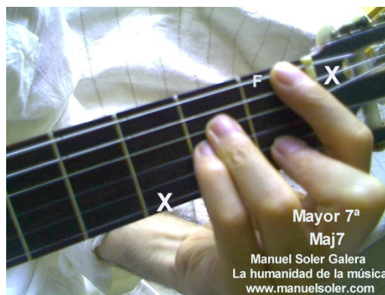
Sol Maj7, Fund Traste 3