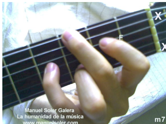
Mim7, Fund Traste 2