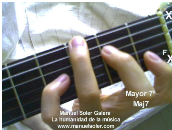
Re Maj7, Fund Traste 3