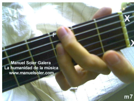
Fa#m7, Fund Traste 2