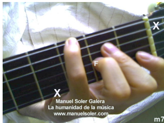
Sim7, Fund Traste 4