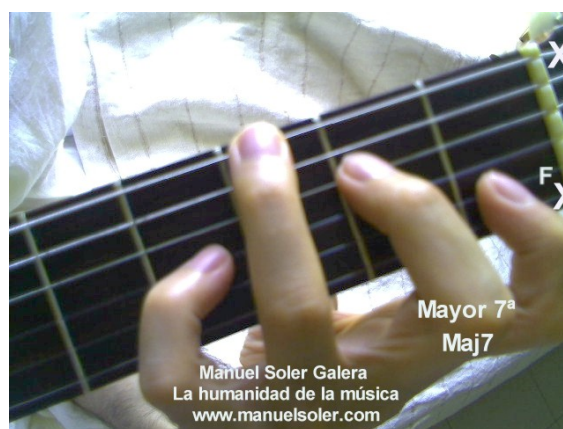
Re Maj7, Fund Traste 3