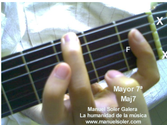
La Maj7, Fund Traste 2