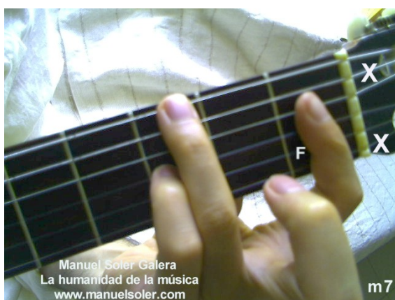
Do#m7, Fund Traste 2