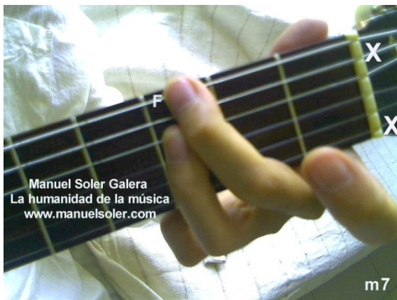
Lam7, Fund Traste 5