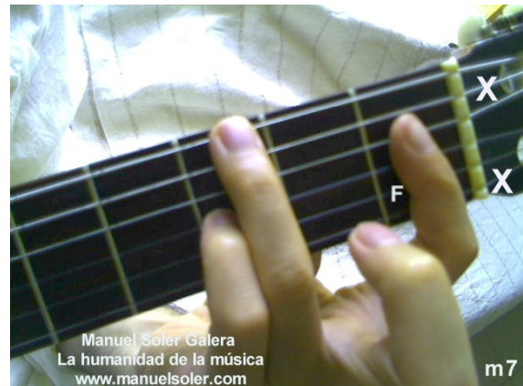
Rem7, Fund Traste 3