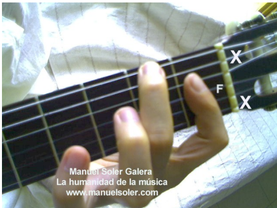
Do7, Fund Traste 5