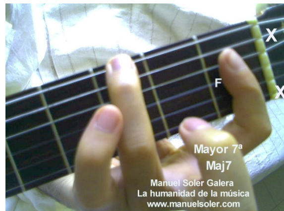
Sib Maj7, Fund Traste 3