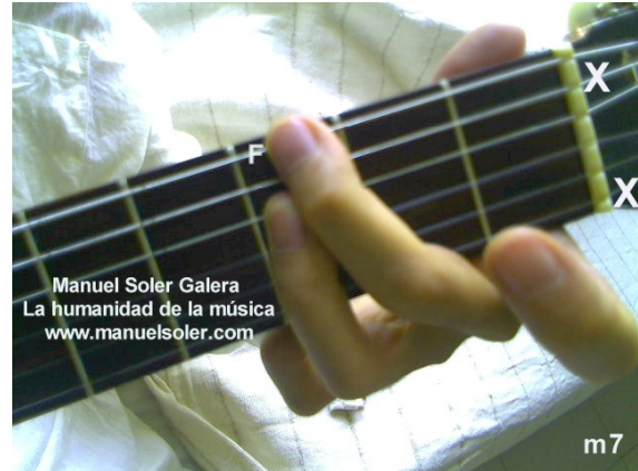
Solm7, Fund Traste 3